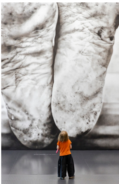
Maurizio Cattelan, Father , 2021 Exposition Dimanche sans fin

L'artiste Marina Abramović propose aux visiteurs de trier minutieusement grain de riz et lentilles. Un geste simple et exigeant qui convoque attention, rigueur et écoute de soi. Une œuvre à vivre en silence.