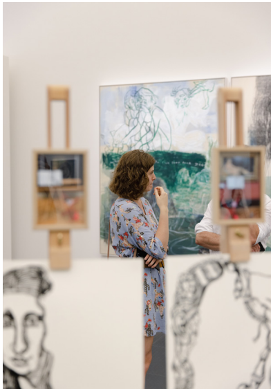
Rita Ackermann, Youth Activities 1 (Activités de jeunesse) (détail), 2025 © Rita Ackermann. Courtesy the artist and Hauser & Wirth Photo : © Centre Pompidou-Metz / Romain Gamba / 2025 / Exposition Copistes