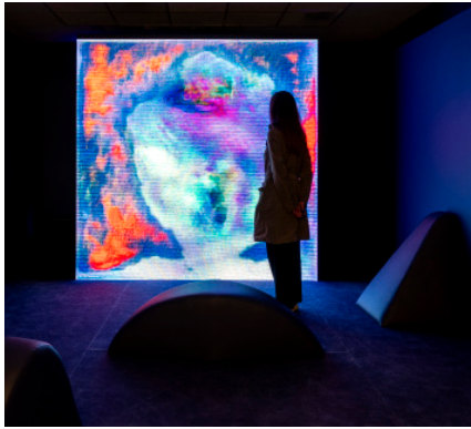
Marco Perego, The Being , 2025