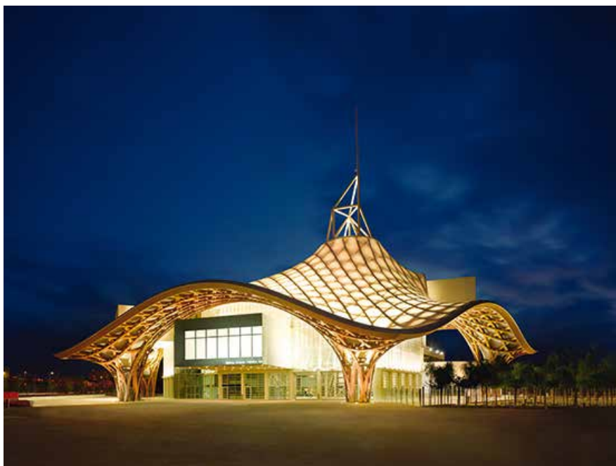
© Shigeru Ban Architects Europe et Jean de Gastines Architectes, avec Philip Gumuchdjian pour la conception du projet lauréat du concours / Metz Métropole / Centre Pompidou-Metz

01.04 > 31.10 LUN. | MER. | JEU. | 10:00 – 18:00 / VEN. | SAM. | DIM. | 10:00 – 19:00