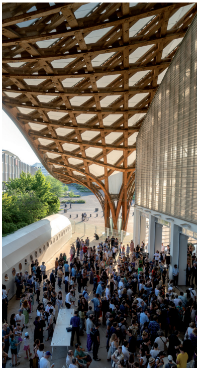
© Shigeru Ban Architects Europe et Jean de Gastines Architectes, avec Philip Gumuchdjian pour la conception du projet lauréat du concours / Metz Métropole / Centre Pompidou-Metz / Photo Marc Damage