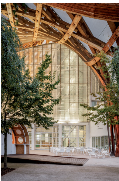
© Shigeru Ban Architects Europe et Jean de Gastines Architectes, avec Philip Gumuchdjian pour la conception du projet lauréat du concours / Metz Métropole / Centre Pompidou-Metz

Ce projet s'inscrit dans le programme national « 100 x Morellet » initié par le Centre Pompidou.