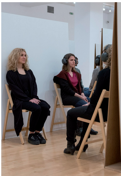
Marina Abramovic: In Residence at Kaldor Public Projects.