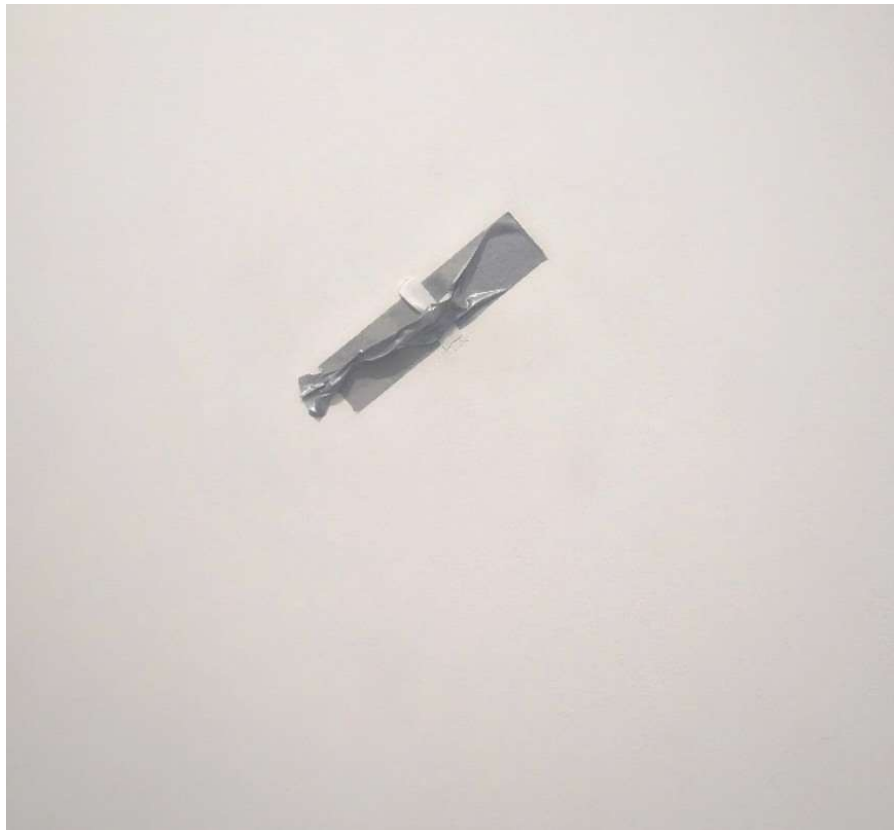
© Photographie prise au Centre Pompidou-Metz le 30 mai 2026.

Créée en 2019, Comedian est l'une des œuvres les plus emblématiques et commentées de l'art contemporain. Présentée pour la première fois à Art Basel Miami Beach, elle consiste en une banane fixée au mur par un ruban adhésif. L'œuvre interroge l'héritage du ready-made , les traditions de la nature morte et de la vanitas dans l'histoire de l'art, ainsi que les mécanismes de valeur, de circulation et de réception des œuvres d'art.