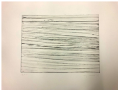
Kimsooja, Sewing into Drawing , 2023

Ed. 40 + 20 EA, numérotées, titrées et signées par l'artiste