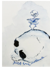
Annette Messenger, Petite Danse matinale , 2021

Ed. 60 + 10 EA, numérotées, titrées et signées par l'artiste