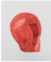
Ronan Bouroullec, Sans titre , 2020

En vente à la librairie-boutique du Centre Pompidou-Metz et sur la boutique en ligne :