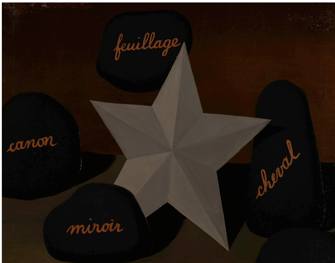
René Magritte, Querelle des Universaux , [1928]