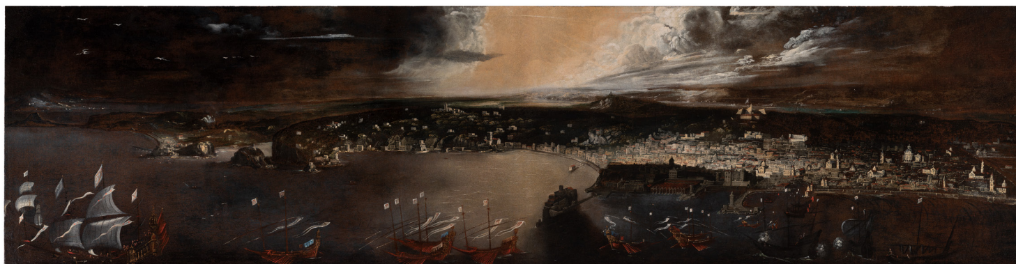
Monsù Desiderio, Vue panoramique du golfe de Naples et de Pouzzoles depuis la mer , 1623. Huile sur toile, 71 x 273 cm