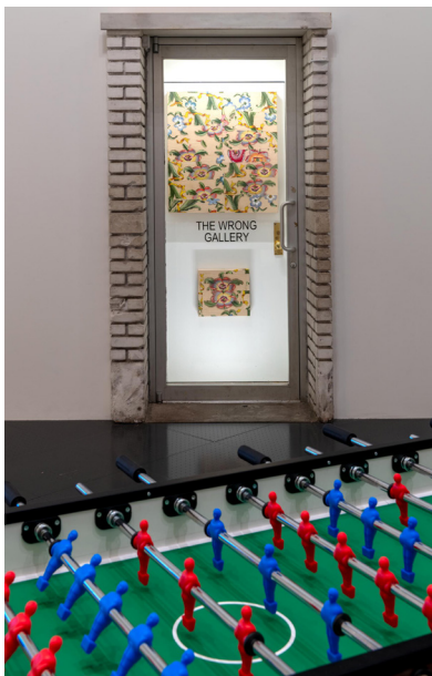
Maurizio Cattelan, Stadium , 1991 et The Wrong Gallery , 2005. Courtesy Maurizio Cattelan's Archive Sidival Fila, Mother Flower , 2025 et Daughter Flower , 2025 - Collection de l'artiste Photo : © Centre Pompidou-Metz / Marc Damage / 2025 / Exposition Dimanche sans fin