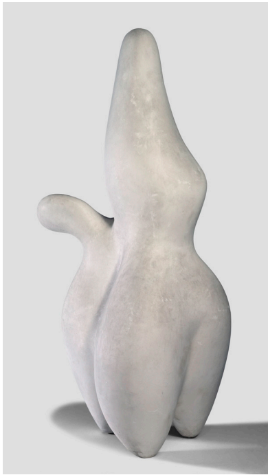
Jean Arp, Berger des nuages , [1953] Plâtre, 320 x 123 x 220 cm Paris, Centre Pompidou, Musée national d'art moderne © Adagp, Paris 2025