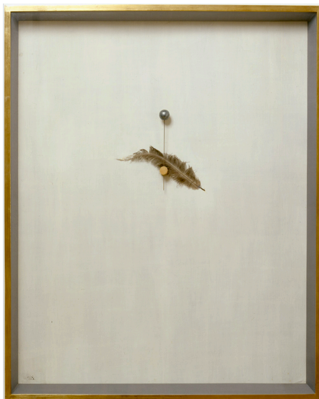
Joan Miró, Portrait d'une danseuse , printemps 1928 Bouchon de liège, plume et épingle à chapeau sur carton peint, 100 x 80 cm © Successió Miró / Adagp, Paris, 2025