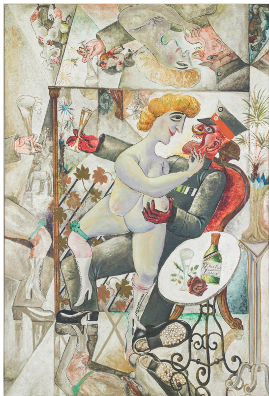
Otto Dix, Erinnerungen an die Spiegelsäle von Brüssel (Souvenirs de la galerie des glaces à Bruxelles), 1920 Huile et glacis sur fonds d'argent sur toile, 124 x 80,4 cm © Adagp, Paris, 2025 Photo : © Centre Pompidou, MNAM-CCI/Hélène Mauri/Dist. GrandPalaisRmn