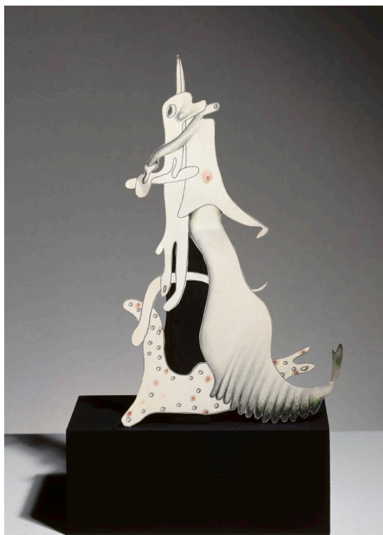
Yves Tanguy, Petit personnage familial , 1938