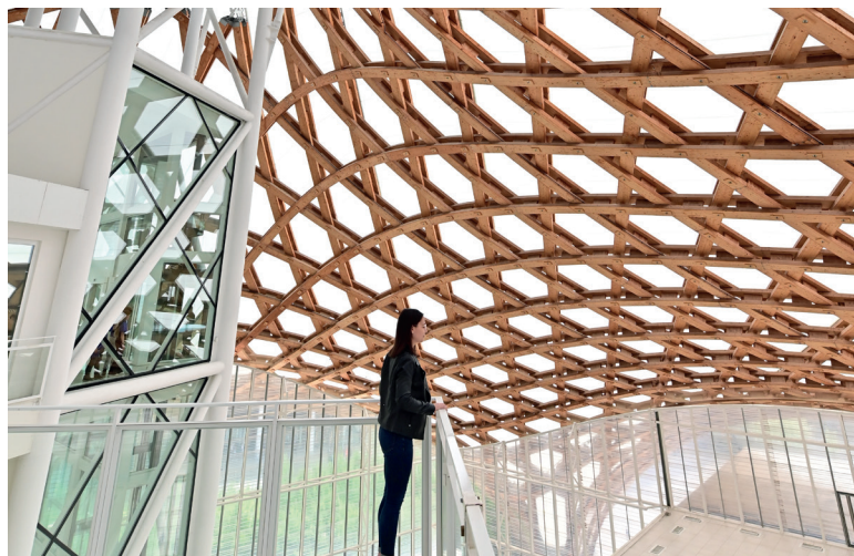
Centre Pompidou-Metz © Shigeru Ban Architects Europe et Jean de Gastines Architectes, avec Philip Gumuc-hdjian pour la conception du projet lauréat du concours / Metz Métropole / Centre Pompidou-Metz / 2022